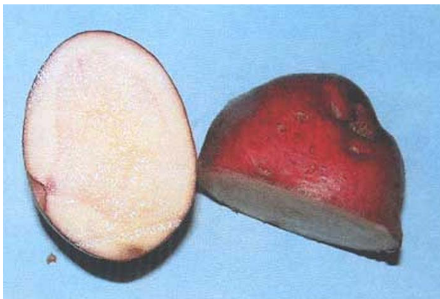
La patata rossa di Cetica